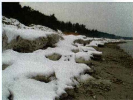
Skamlebæk Strand i vinterklær