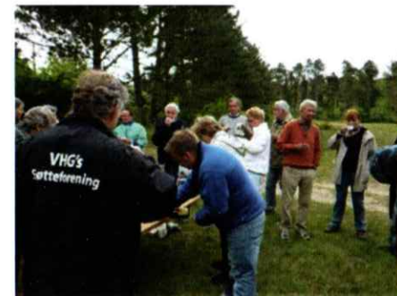
Til almindelig inspiration viser vi her et lille udpluk af fotos fra tidligere arbejdsdage.

Det bliver hyggeligt, uanset vejret. Der er ingen tilmeldingspligt – I kan bare møde op på pladsen ved Fyrregården på dagen, men det er naturligvis altid rart med en mail- eller telefonisk tilmelding, så vi kan købe basser nok.