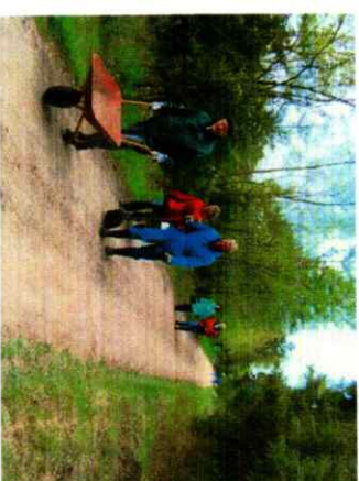
"Vejholder mod nye opgaver"

Arbejdsdeltagere sluttede dagen med en mindre frokost på "Den Blå Ged" i Ordrup. Alt i alt en meget udbytterig og hyggelig dag. P. B-M