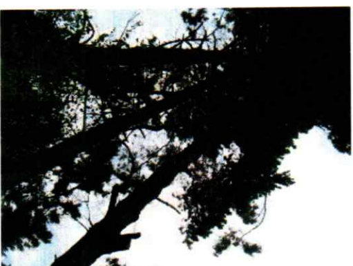
Pas på i De kan falde i en efterårsstorm

Mange medlemmer har gjort os opmærksom på 2 store halvt væltede fyrretræer der står og truer med at falde ud over vejen på hjørnet af Bierbumsvej og Nålestien. Vi har talt med grundejeren der har lovet, at de meget snart vil blive fjernet. Vi håber det sker, før nogen kommer til skade. KG