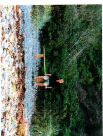
Bænken har nu holdt flytedag

På den fælles arbejdsdag d. 7. maj lavede vi en flot ny udsigtsbænk på stranden mellem Bierbumsvej og Tangvej. Desværre fik vi den gravet ned et sted på stranden, hvor den var til gene for grundejeren, og da vi absolut ikke ønsker dette – og at bænken dermed skulle blive et fremtidigt diskussionspunkt, er den nu i samarbejde med grundejeren, blevet flyttet nærmere Bierbumsvejens nedgang - til alles tilfredshed. KG