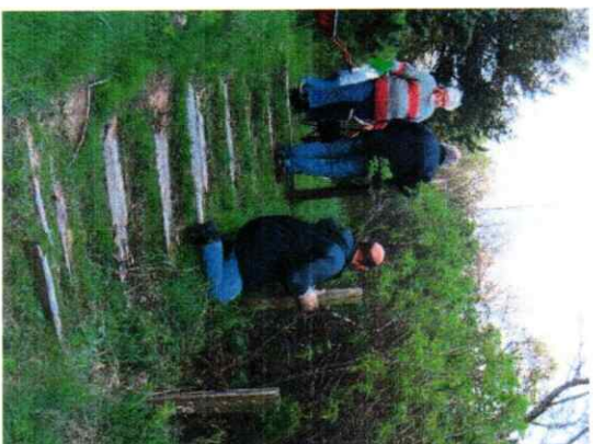
Stemningsbilleder fra arbejdsdagen.