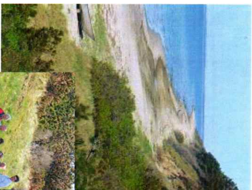
Sommer ved Skamlebak Strand